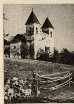
Die Pfarrkirche mit dem Doppelturm in Unterdeutschau