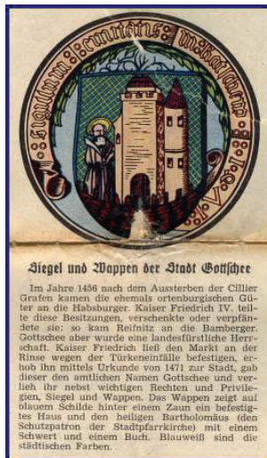
Siegel und Wappen der Stadt Gottschee

Im Jahre 1456 nach dem Aussterben der Cillier Grafen kamen die ehemals ortenburgischen Güter an die Habsburger. Kaiser Friedrich IV. teilte diese Besitzungen, verschenkte oder verpfändete sie; so kam Reinfritz an die Bamberger. Gottschee aber wurde eine landesfürstliche Herrschaft. Kaiser Friedrich ließ den Markt an der Ränne wegen der Türkeninfälle befestigen, erhob ihn mittels Urkunde von 1471 zur Stadt, gab dieser den amtlichen Namen Gottschee und verlieh ihr nebst wichtigen Rechten und Privilegien, Siegel und Wappen. Das Wappen zeigt auf blauem Schilde hinter einem Zaun ein befestigtes Haus und den heiligen Bartholomäus (den Schutzpatron der Stadtpfarrkirche) mit einem Schwert und einem Buch. Blauweiß sind die städtischen Farben.