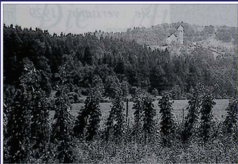
Büchel bei Pöllandl