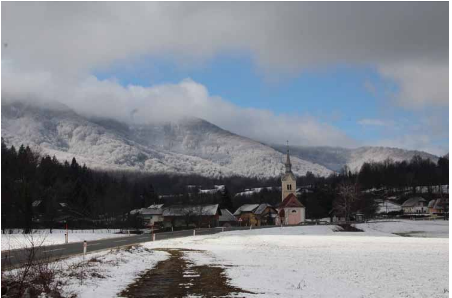
Winteridylle von Wretzen 2016, im Hintergrund der Hornwald

Man nehme 12 Monate, putze sie ganz sauber von Bitterkeit, Geiz, Pedanterie und Angst und zerlege jeden Monat in 30 oder 31 Teile, sodass der Vorrat genau für ein Jahr reicht. Es wird jeder Tag einzeln angerichtet aus 1 Teil Arbeit und 2 Teilen Frohsinn und Humor. Man füge 3 gehäufte Esslöffel Optimismus hinzu, 1 Teelöffel Toleranz, 1 Körnchen Ironie und 1 Prise Takt. Dann wird die Masse sehr reichlich mit Liebe übergossen. Das fertige Gericht schmücke man mit Sträußchen kleiner Aufmerksamkeiten und serviere es täglich mit Heiterkeit.