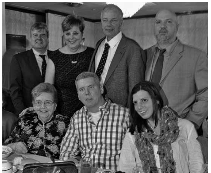
Besucher der Tanzveranstaltung der Gottscheer Vereinigung