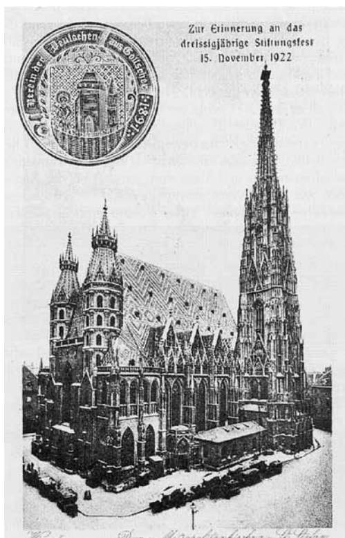
Erinnerungspostkarte der Gottscheer Landsmannschaft in Wien 1922

Aufrichtige Teilnahme, ja tiefe Trauer erweckte es, als sich die Kunde von seinem Hinscheiden am 13. Oktober 1939 verbreitete.