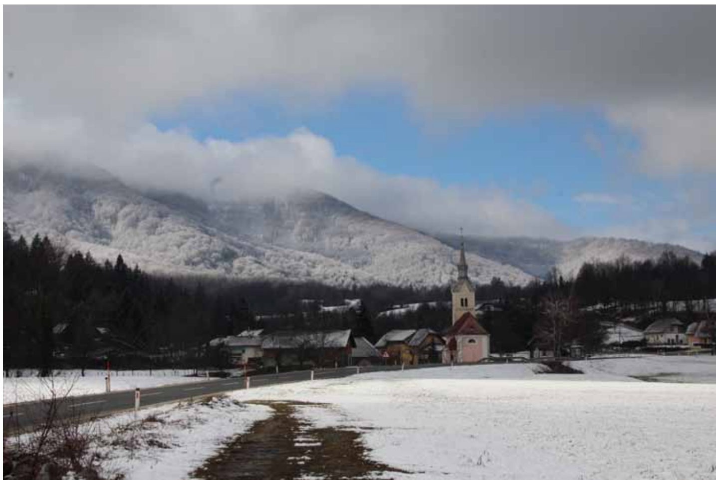
Winteridylle von Wretzen 2016, im Hintergrund der Hornwald

Man nehme 12 Monate, putze sie ganz sauber von Bitterkeit, Geiz, Pedanterie und Angst und zerlege jeden Monat in 30 oder 31 Teile, sodass der Vorrat genau für ein Jahr reicht. Es wird jeder Tag einzeln angerichtet aus 1 Teil Arbeit und 2 Teilen Frohsinn und Humor. Man füge 3 gehäufte Esslöffel Optimismus hinzu, 1 Teelöffel Toleranz, 1 Körnchen Ironie und 1 Prise Takt. Dann wird die Masse sehr reichlich mit Liebe übergossen. Das fertige Gericht schmücke man mit Sträußchen kleiner Aufmerksamkeiten und serviere es täglich mit Heiterkeit.